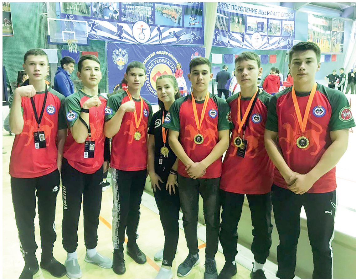
■ Иң көчле егет-кызлар.

– Киләсе елга планлаштырылган Россия беренчелегеннән җиңү алып кайтырга исәп. Кул көрәше үзгәртүне үз итә, шушы спорт төрен фанатларча яратучыларга һәрвакыт уңыш елмая. Минем түгәрәккә йөрүче егет-кызларның юлдашы – ихтыяр көче, зур теләк-максатлар. Алга таба да сынатмасыннар иде! – ди Ларис Бариев.