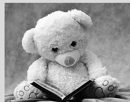
☉ Фото – Pixabay.com