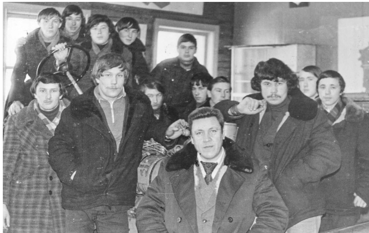
● Һөнәри училищәда. 1980 еллар.